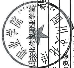
2025年贫困学生奖助支付汇总表