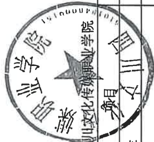
2025年代收费用收支情况表